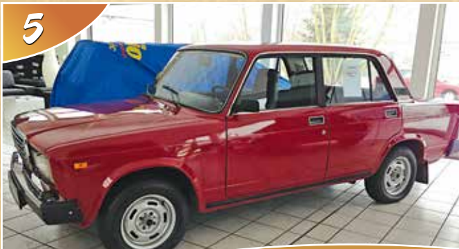
5 Lada 2107, BJ 1988 | Team Volkssolidarität Stephan Busch, Radeburg | Roland Busch, Dresden