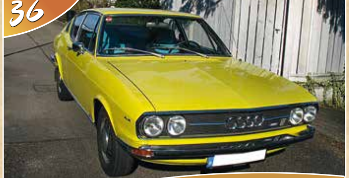
Audi 100 Coupé S, BJ 1974 Uwe Winkler, Ettlingen | Elke Winkler, Ettlingen