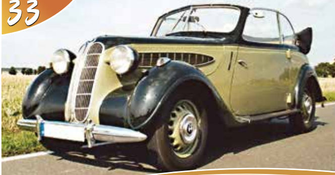
BMW 321/1 Cabrio, BJ 1939 Bernd Schmiedel, Neukirchen/Pleiße | Hildegund Schmiedel, Neukirchen/Pl.